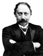
EDVARD BRANDES (1847-1931) STIFTER AF POLITIKEN I 1884