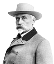
VIGGO HØRUP (1841-1902) STIFTER AF POLITIKEN I 1884

250 læserbreve og debatindlæg handlede om lærerkonflikten